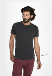
REGENT FIT 00553