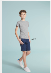
REGENT FIT KIDS 01183